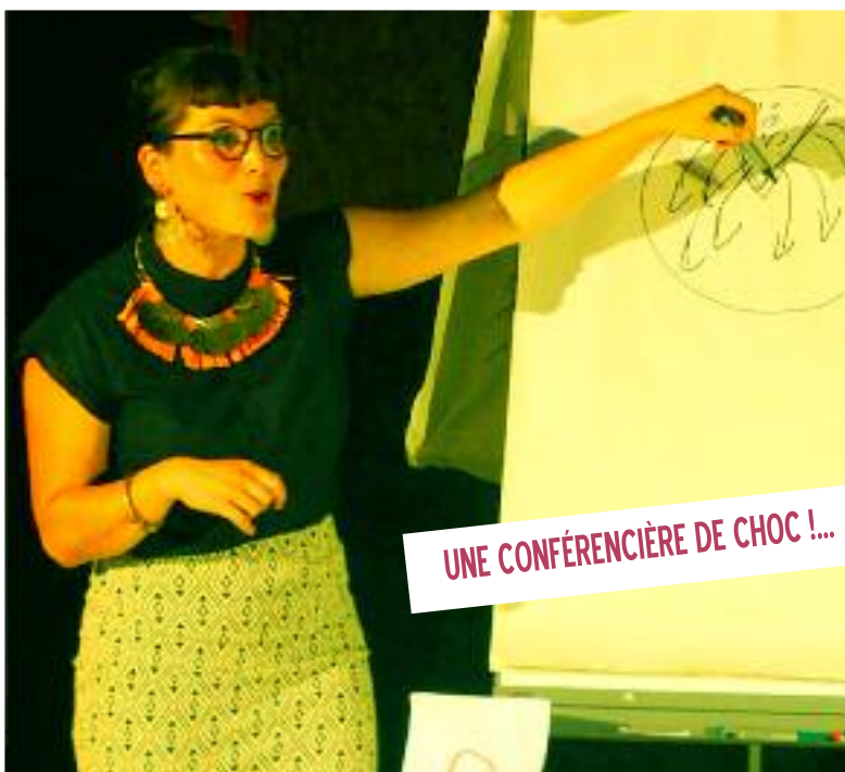
UNE CONFÉRENCIÈRE DE CHOC !...