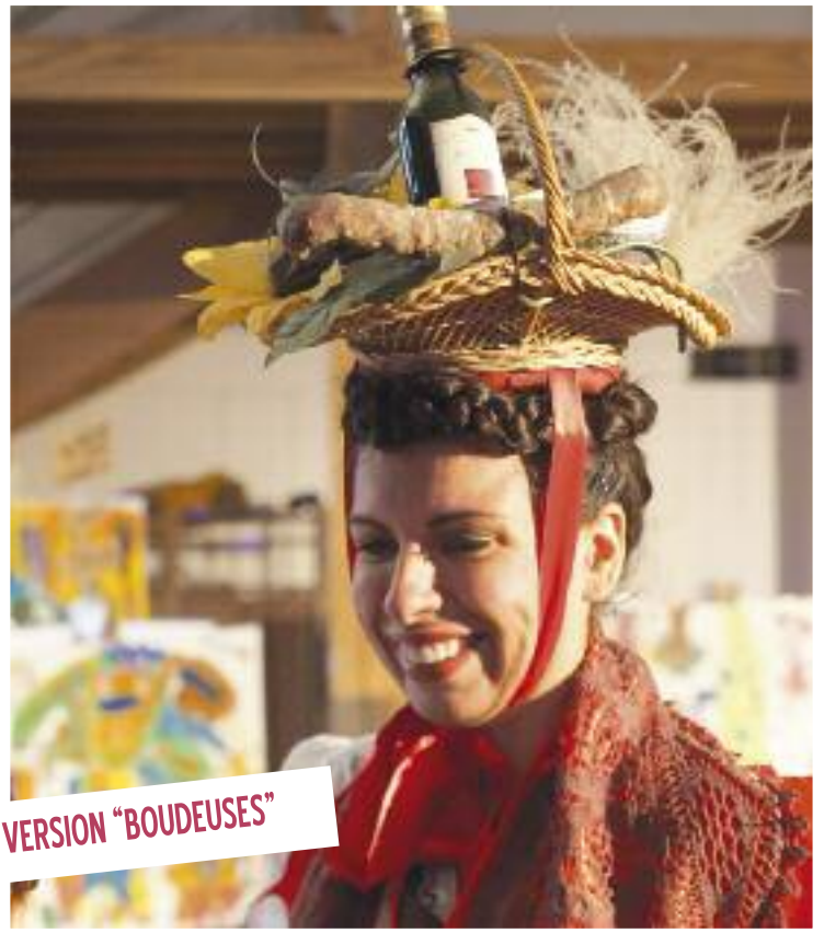
REINE D'OCCITANIE VERSION "BOUDEUSES"